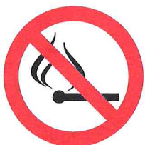
uporaba odprtega ognja prepovedana