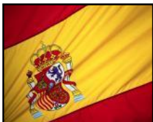
La bandera española