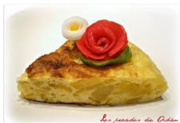
La tortilla de patatas