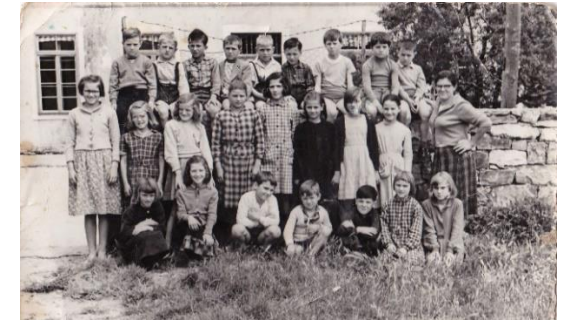
Slika pred staro šolo iz leta 1959

Leta 1976 se pouk preseli v montažno stavbo v Čedljah. Prične se celodnevna osnovna šola, ki poteka do leta 1990.