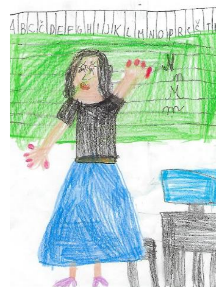
Avtorica ilustracije: Nika Hrvatinić