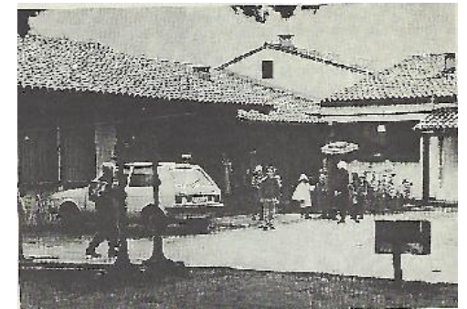
Montažna šola 1976

Leta 1976 se pouk preseli v montažno stavbo v Čedljah. Prične se celodnevna osnovna šola, ki poteka do leta 1990.